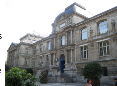
Le musée des Beaux Arts