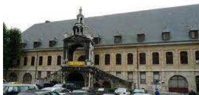
La Halle aux Toiles

Cette organisation a demandé, demande et demandera bien sur encore beaucoup de travail au réseau, au conseil scientifique et au comité local d'organisation. A ce jour, tout se déroule comme prévu et, chère(e)s membres, saluons le travail de la cellule de coordination du réseau Onco-Normand qui mène ce projet avec efficacité.