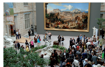
Le musée des Beaux Arts