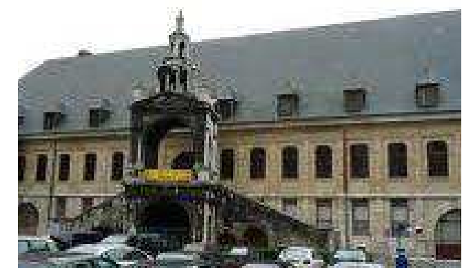
La Halle aux Toiles